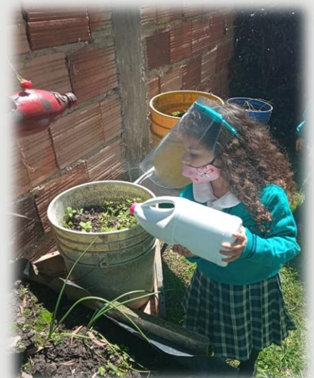
Imágenes de archivo: Huerta 2021.