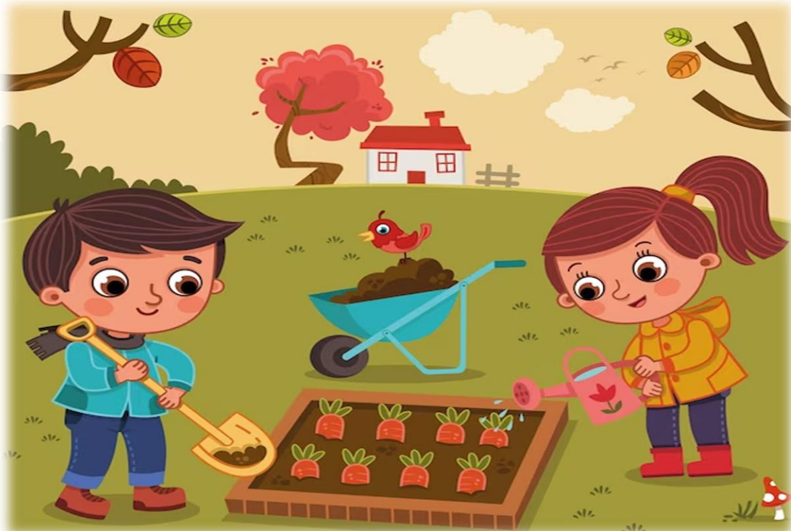
Proyecto de huerta escolar – 2024.