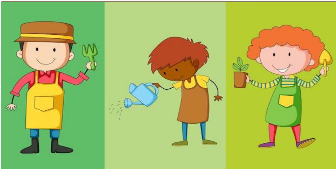
Practica – Cultivo de Semillas.