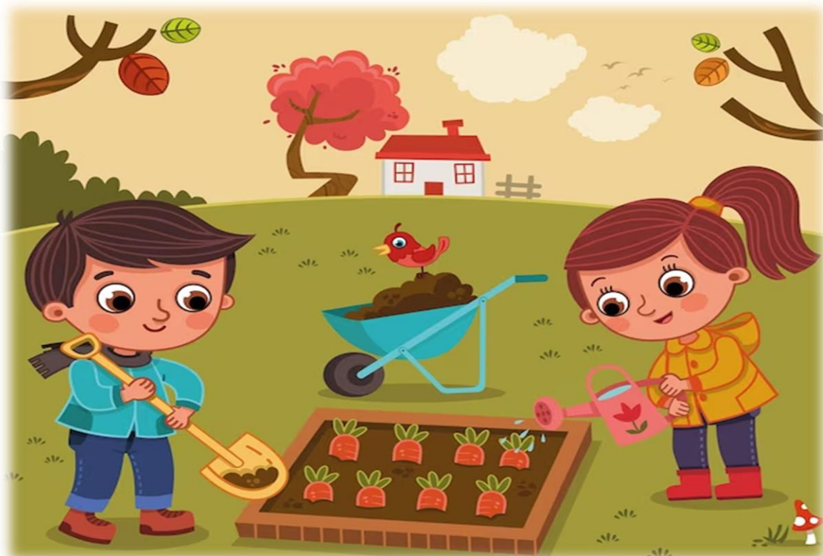
Proyecto de huerta escolar – 2024.